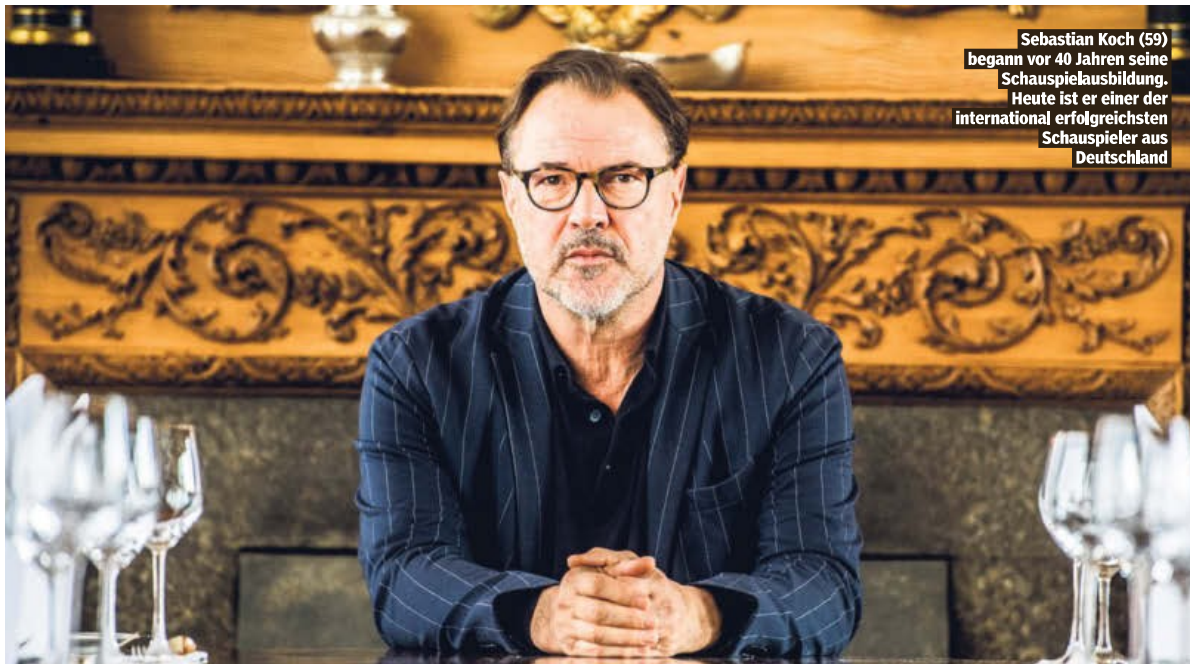
Sebastian Koch (59) begann vor 40 Jahren seine Schauspielerausbildung. Heute ist er einer der international erfolgreichsten Schauspieler aus Deutschland